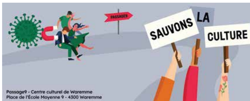
Passage9 - Centre culturel de Waremme Place de l'École Moyenne 9 - 4300 Waremme